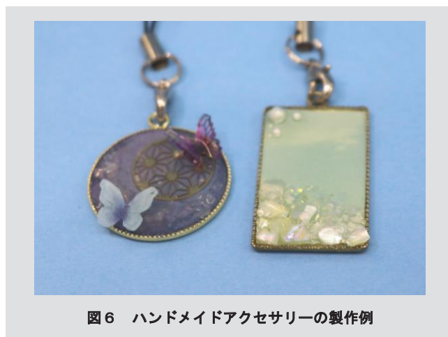
図6 ハンドメイドアクセサリの製作例

図5は、釘や針、ビーズといった身近な材料を接着した造形物の製作例である。曲面のある材料も、曲面部分の隙間まで液を塗布して照射することで、容易に接着できる。