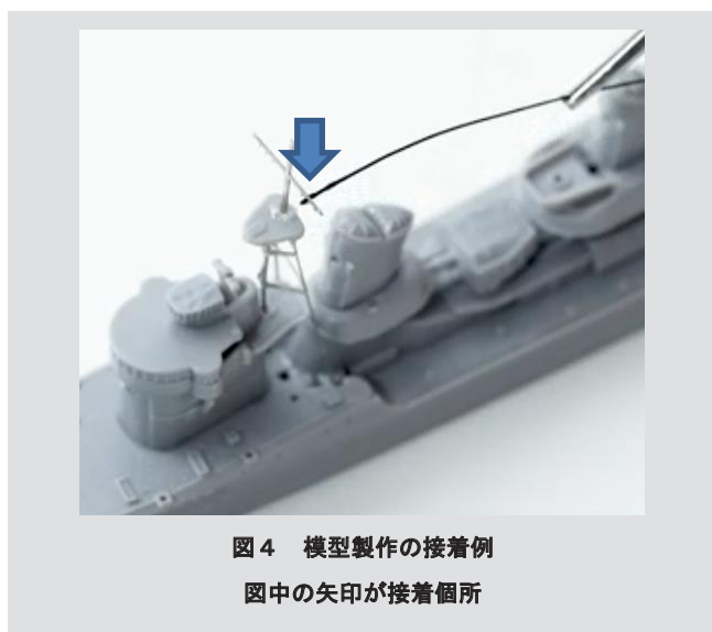
図4 模型製作の接着例