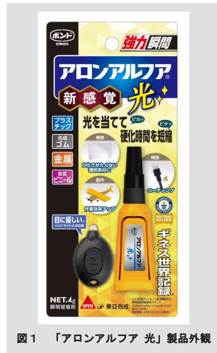
図1 「アロンアルファ 光」製品外観

我々はこの課題を解決する、従来製品とは一線を画する新製品の開発を進めてきた。この度、2つの硬化方法を併せ持った新製品「アロンアルファ 光」(図1)の開発に成功したので、以下に紹介する。