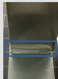
図2 補強するときの接着例 青枠部分が、接着剤を追加で塗布、硬化した箇所

この方法で接着面の側面に硬化物を形成すると、側面の硬化物が補強部として働き、より強い接着強さを発現することができる。試験として、ABSないしアルミニウム(AL)の平板(厚さ2mm×幅25mm)をT字状に接着し、先の手順に従って補強部を作成し、接着試験片とした(図2)。