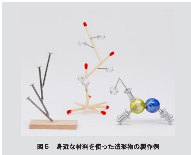
図5 身近な材料を使った造形物の製作例

図4は、模型のパーツとして空中線を接着する様子である。空中線の方に接着剤を塗布し、貼り合わせて照射すると、空中線周りの接着剤が硬化しすぐに接着できる。